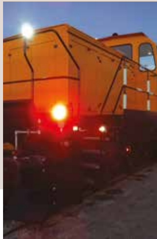
Confort du poste de conduite