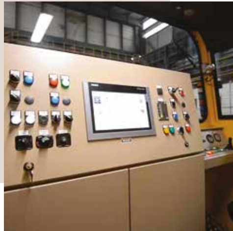
Poste de conduite ergonomique avec commande traction/freinage par joystick