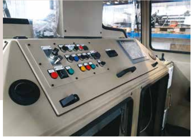
Poste de conduite