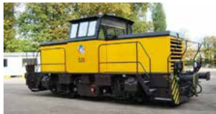
NH 500 B 525 CV - 60 km/h