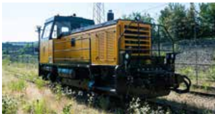
NH 300 B 350 CV - 30 km/h