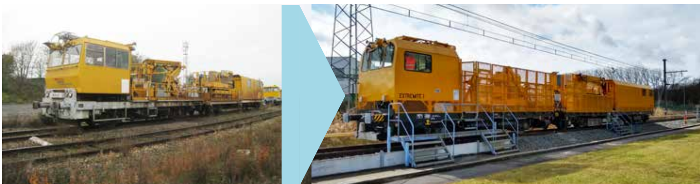
Engin de Maintenance Caténaire avec transmission hybride modernisé