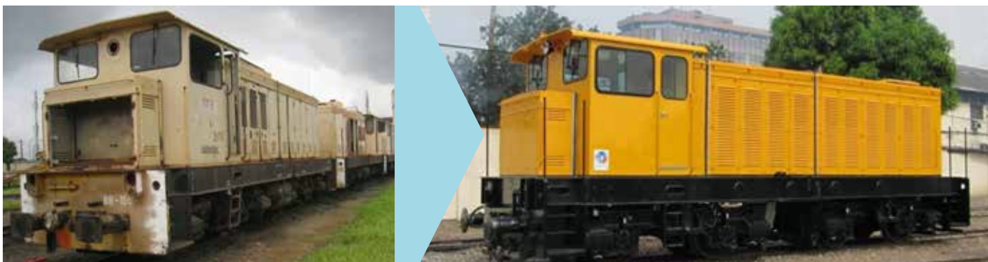
Locomotive hydrodynamique Henschel modernisée (Côte d'Ivoire)

De plus, une modernisation effectuée dans les ateliers du client, avec ses équipes, permet de se former sur le nouveau matériel.