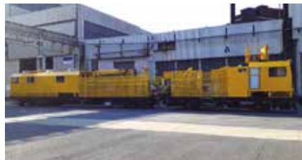
Engin de maintenance caténaire 550 CV - 100 km/h