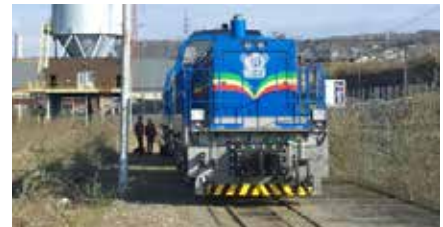
DE 1200 BB 1200 CV - 90 km/h