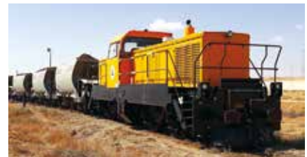
NH 700 BB 750 CV - 35 km/h