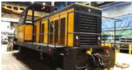
DE 600 C 612 CV - 50 km/h